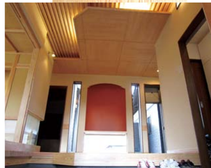
●広々とした玄関ホール